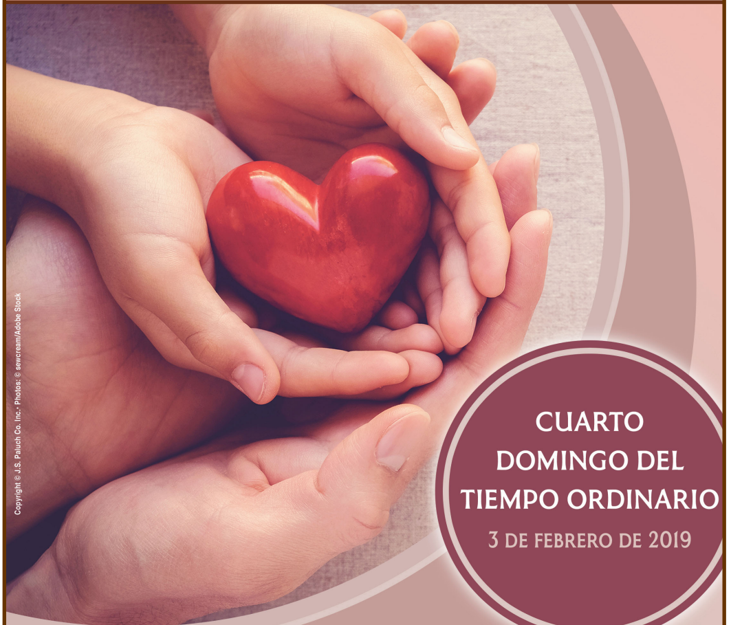
Copyright © J.S. Pauch Co. Inc.