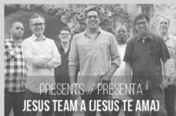
PRESENTS // PRESENTA JESUS TEAM A (JESUS TE AMA)

This day is all about...Music, food, interactive art, children's activities, inspirational stories and so much more. Invite your friends, family and neighbors for a day to remember! All are welcome!