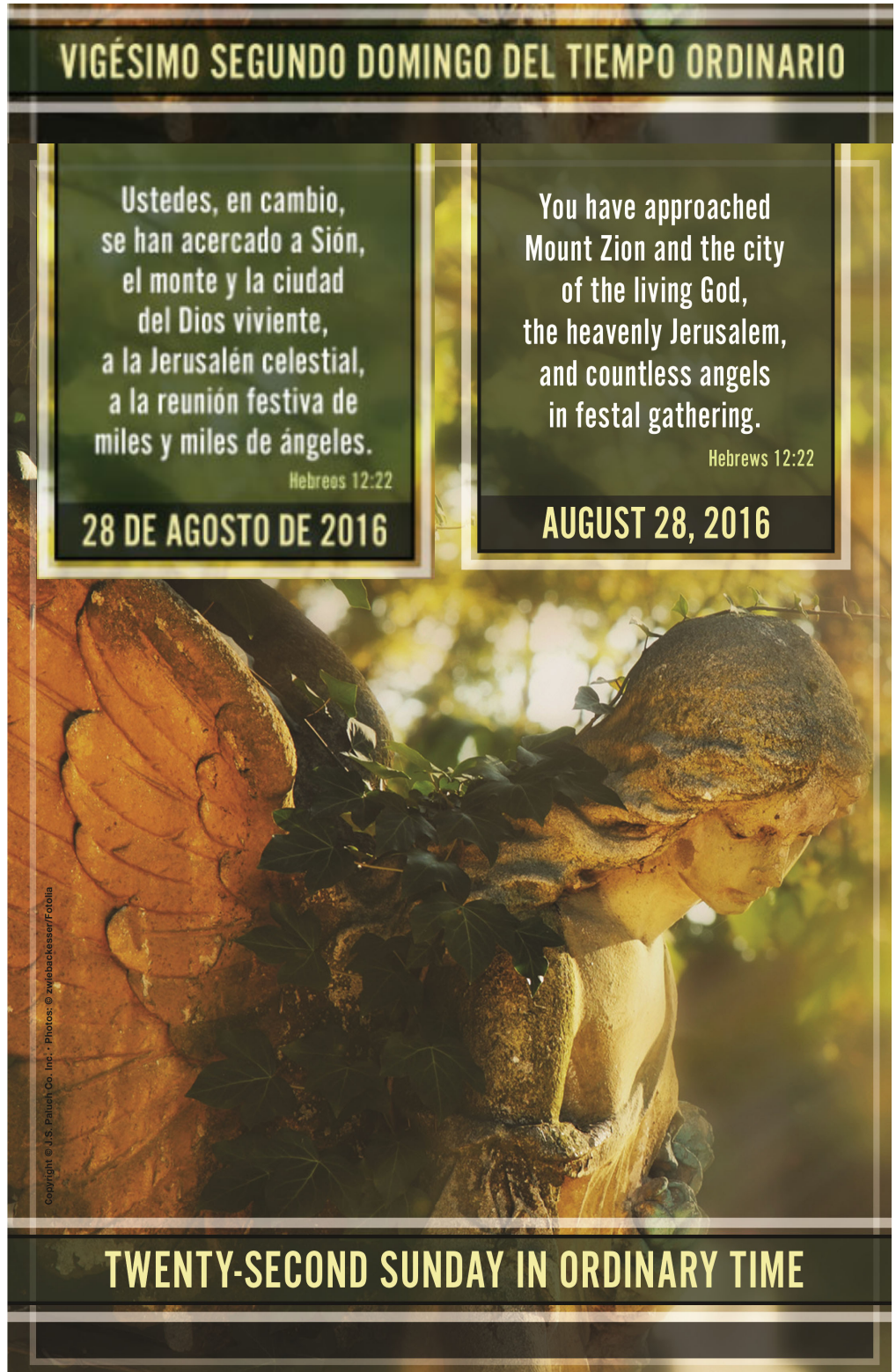
Copyright © J.S. Palumbo, Co. Inc. - Photos: © zweibackesser/Fotolia