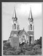
Shrine of Mary, Help of Christians