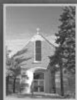
National Shrine of Our Lady of Good Help