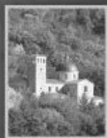
Shrine of Our Lady of Guadalupe