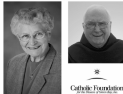
Catholic Foundation of the Diocese of Green Bay