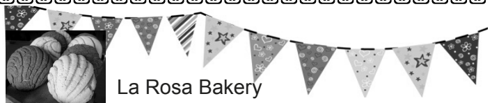
La Rosa Bakery

We will have Mexican Food available for sale after each mass Saturday, Sunday and Monday.