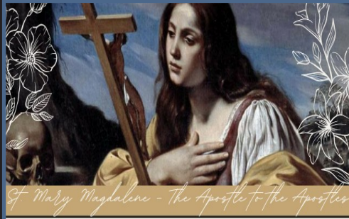
St. Mary Magdalene - The Apostle to the Apostles

Nuestra colecta anual de sopas Souper Bowl Sunday se llevará a cabo durante el fin de semana del Super Bowl, del 8 al 9 de febrero, así como el fin de semana siguiente, del 15 al 16 de febrero. Apreciamos especialmente las sopas sustanciosas que pueden servir como comida (por ejemplo, sopas Chunky o Progresso). Sus donaciones se pueden colocar en la caja marrón ubicada en el pasillo de la iglesia. ¡Únase a nosotros para 'alimentar a los hambrientos en nuestra puerta'! ¡Gracias por su generosidad!